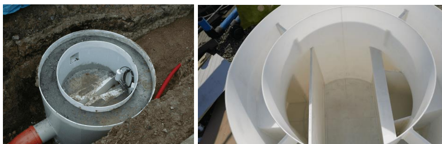
Obr.: Ukázky šachtových den

Polypropylénová dvouplášťová šachtová patka jako ztracené bednění pro nástavbu ze standardních betonových skruží s Parshallovým žlabem. Šachtová dna se vyrábí v dimenzi DN 1000 a DN 1500.